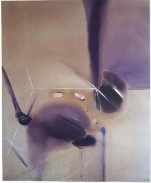
Peter Blaas Abstrakt, 1968 Aquatex auf Leinwand, 100 x 90 cm Inv. Nr. Gem/5454