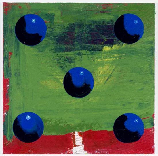
Éva Bodnár GOTTWÜRFELT NICHT „fünf“, 2018 Acryl auf Leinwand, 80 x 80 cm Inv. Nr. Gem/5376