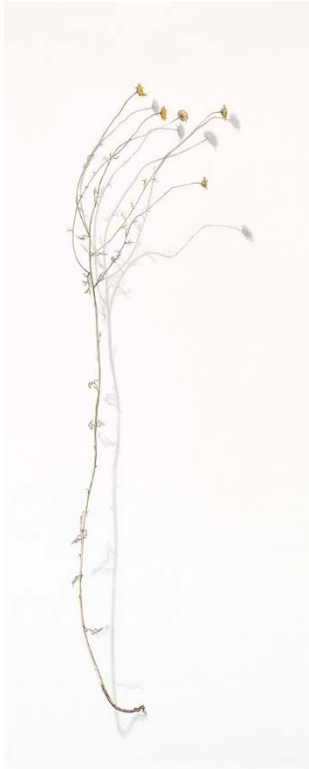
Alexandra Kontriner Färberkamille, Bleistift und Aquarell auf geprägtem Büttenpapier, 100 x 40 cm Inv. Nr. K/466