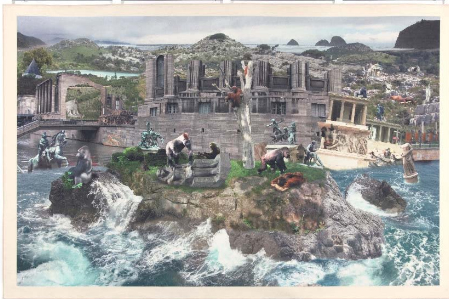
Hans Weigand Rückkehr zum Planet der Affen, 2006 Druck auf Teppich, 215 x 350 cm Inv. Nr. Gem/4662