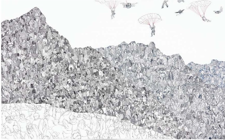
Olga Georgieva Aus der Serie „Two travelers are standing“, 2018 Tusche auf Leinwand, 100 x 160 cm Inv. Nr. Gem/5456