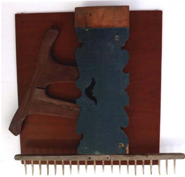
Hermann Graber Armes Tirol, 2015 Holz, 70 x 63 x 5 cm Inv. Nr. P/2548